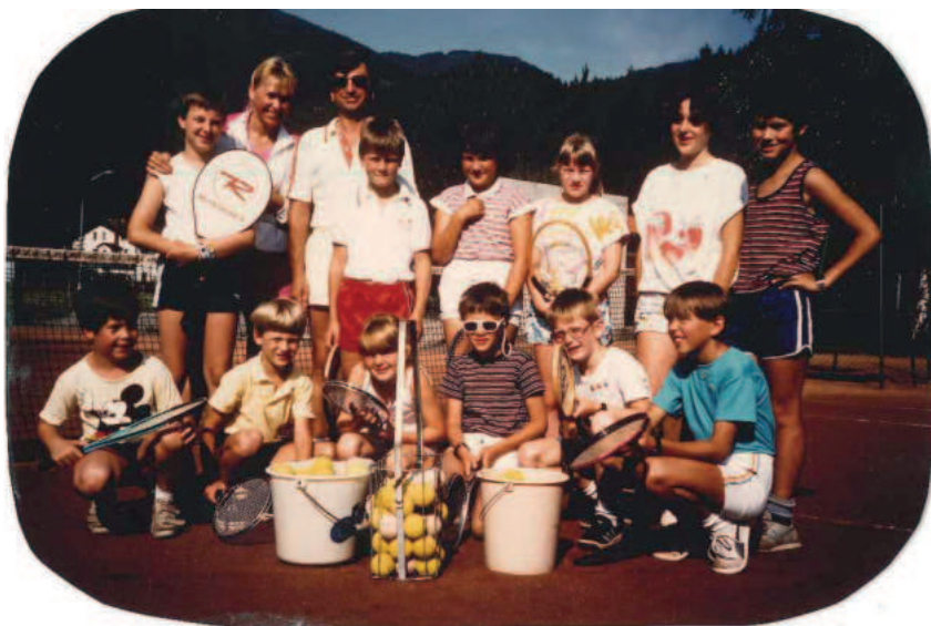
Damals... Die Ferientenniswoche ist mittlerweile ein "Klassiker": Bereits seit den Anfangszeiten wird der Tennis-Nachwuchs gefördert.

Natürlich besteht auch für interessierte Jugendliche und Erwachsene die Möglichkeit, diesen schönen Sport kennen zu