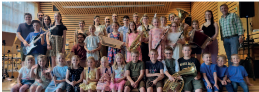
RUND 80 BESUCHERINNEN UND BESUCHER ÜBERZEUGTEN SICH BEIM MUSIKSCHULKONZERT IM HANS-RICHTER-SAAL VOM KÖNNEN DES MUSIKALISCHEN NACHWUCHSES.