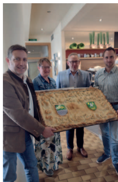
DAS SPEZIALGEBÄCK WURDE AN DIE GEMEINDEFÜHRUNG VON KLEINZELL ÜBERGEBEN.