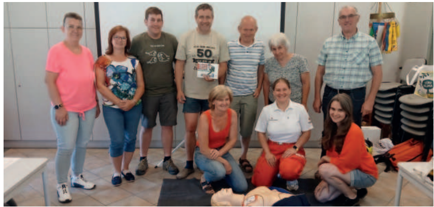
DIE GEMEINDE KLEINZELL ORGANISIERTE IN ZUSAMMENARBEIT MIT DER ROTKREUZ-BEZIRKSSTELLE HAINFELD EINEN ACHTSTÜNDIGEN ERSTE-HILFE-KURS.