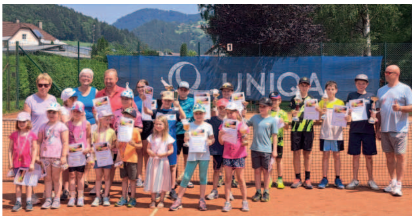
...und heute: Nach wie vor ist die Ferientenniswoche bei den Kindern beliebt. Auch Erwachsene können "schnuppern".

lernen. Die Schnupperstunden für Jugendliche und Erwachsene finden in den Abendstunden von 17:00 bis 20:00 Uhr statt. "Über reges Interesse und neu gewonnene Tennisfreunde würden wir uns sehr freuen", ist sich der Tennis Club einig.